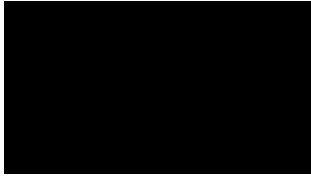
Immagine del pubblico