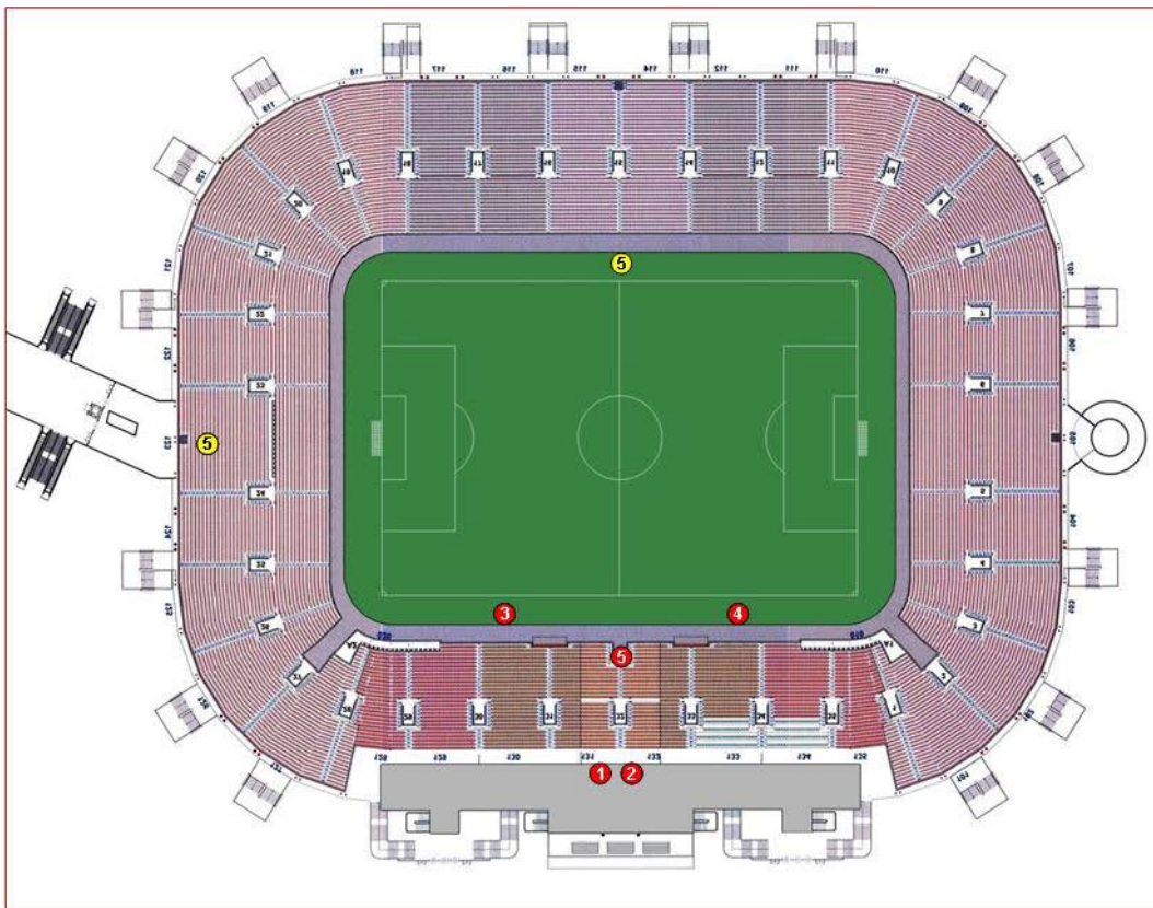
Schema 5 cam

Il posizionamento delle telecamere è indicativo e soggetto alle eventuali variazioni imposte da esigenze logistiche relative alle strutture degli stadi.