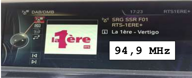
Visualizzazione del logo nella radio